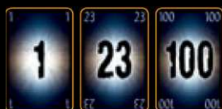
100 číselných karet (1-100)