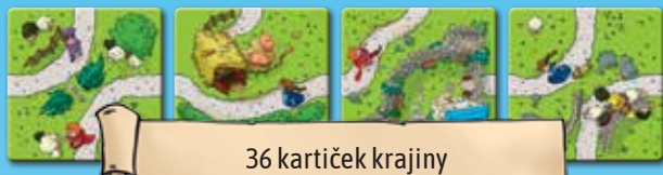
36 kartiček krajiny

Tato pravidla hry, 36 kartiček krajiny, 32 figurek dětí (8 v každé ze čtyř barev).